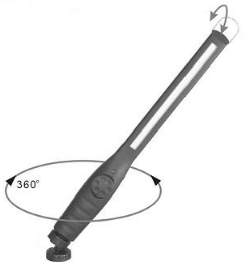
Kloub magnetu umožňuje různá nastavení