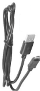
USB nabíjecí kabel