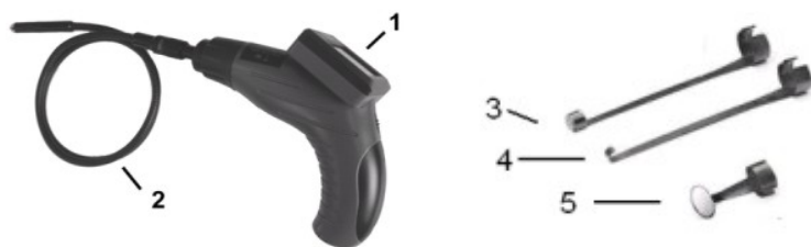
Schéma zapojení nářadí