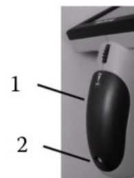
Obr. č. 1: