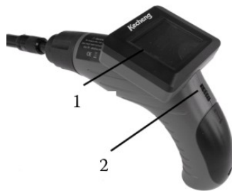
1. LCD obrazovka 2. Spínač