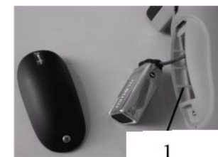
Obr. č. 2: